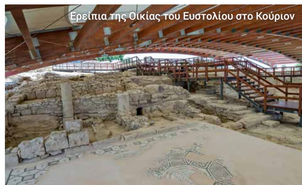
Ερείπια της Οικίας του Ευστολίου στο Κούριον

Μετά το μεσημεριανό, επισκεπτόμαστε τη Μονή Τιμίου Σταυρού και το μεσαιωνικό πατητήρι. Θα απολαύσουμε μια ιδιαίτερη οινογευσία στο κελάρι ενός χωρικού πριν επιστρέψουμε και πάλι, μέσα από την πολύχρωμη πόλη της Λεμεσού, στο λιμάνι όπου μας περιμένει το πλοίο μας.