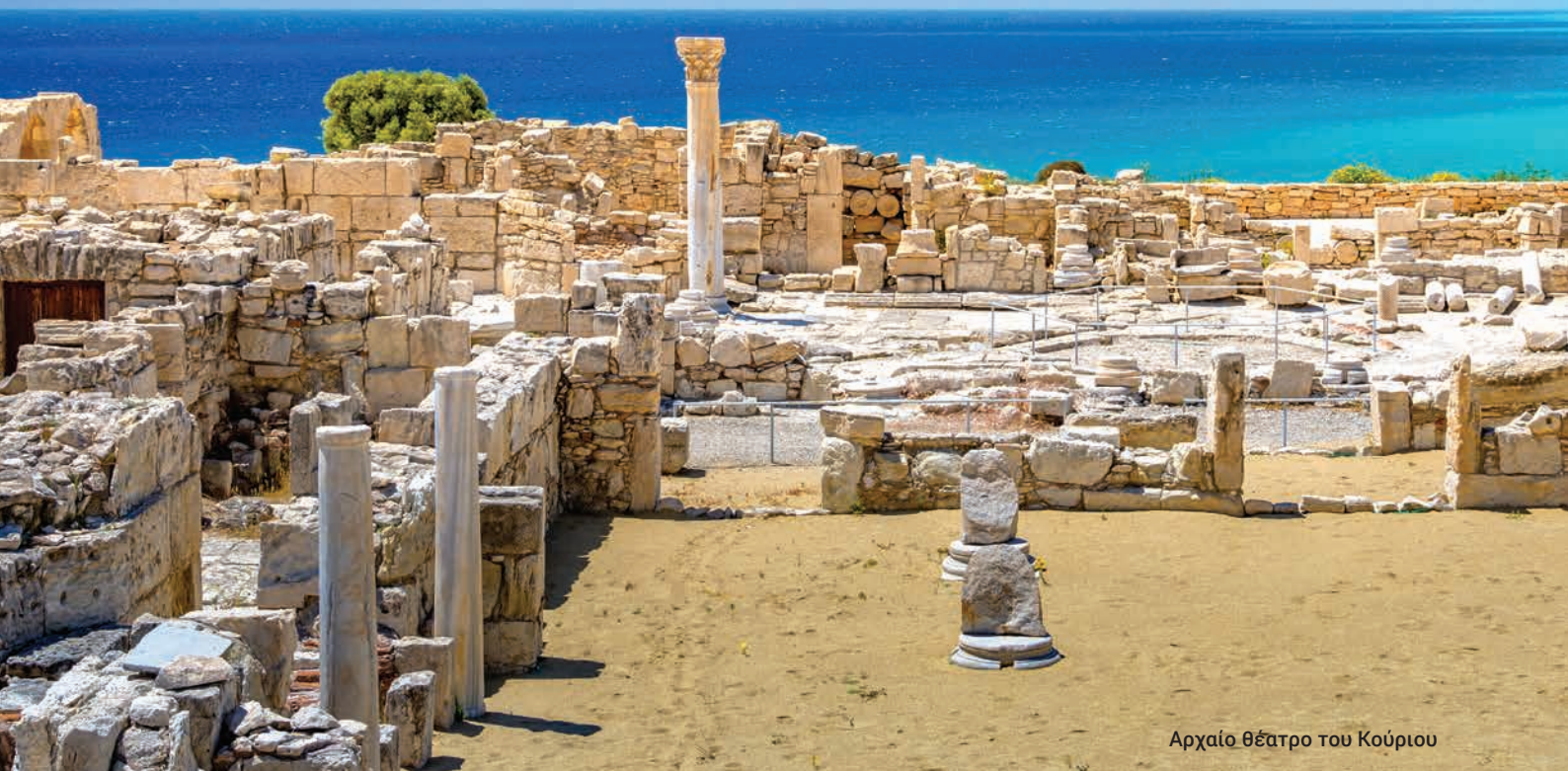
Αρχαίο θέατρο του Κούριου