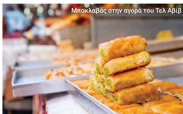
Μπακλαβάς στην αγορά του Τελ Αβίβ

Θα επισκεφτούμε την πολύχρωμη αγορά Carmel και θα γνωρίσουμε τα αξιοθέατα και τους ήχους αυτής της μοναδικά ζωντανής μητρόπολης.