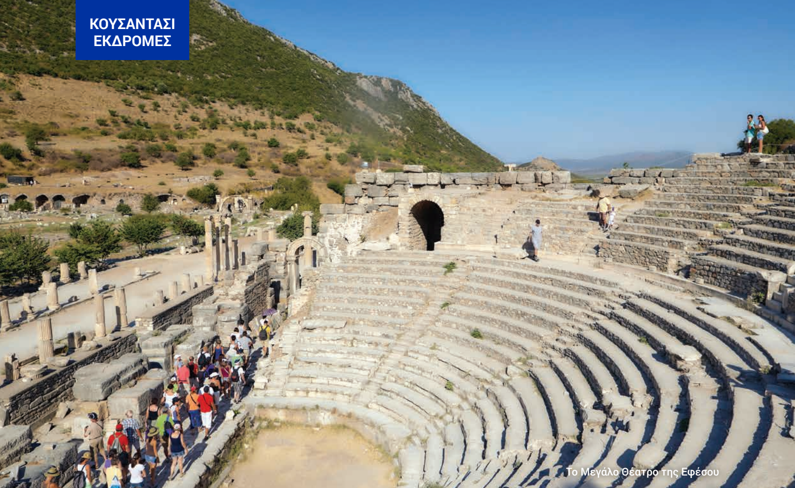
Το Μεγάλο Θέατρο της Εφέσου