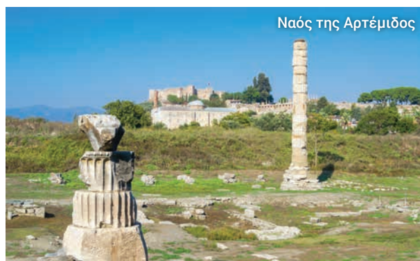
Ναός της Αρτέμιδος

ανακατασκευασμένη, Βιβλιοθήκη του Κέλσου και η Αγορά. Το Μεγάλο Θέατρο της Εφέσου όπου κάποτε κήρυττε ο Άγιος Παύλος, φιλοξενούσε έως και 24.000 άτομα. Σήμερα φιλοξενεί συναυλίες και άλλες παραστάσεις. Καθ' οδόν θα κάνουμε μια στάση για να αγοράσετε αναμνηστικά, χαλιά, κοσμήματα, δερμάτινα, κ.λπ. και να απολαύσετε ένα ελαφρύ μεσημεριανό. Στη συνέχεια, κατευθυνόμαστε στην αρχαία παραλιακή πόλη της Μιλήτου, άλλη μία από τις μεγαλύτερες και πλουσιότερες πόλεις της Αρχαίας Ελλάδας και μία από τις πρώτες που έκοβαν νομίσματα. Ο Όμηρος ανέφερε τη Μίλητο στην Ιλιάδα και ο Παύλος κήρυξε εδώ καθ' οδόν για την επιστροφή του στην Ιερουσαλήμ. Υπάρχουν πολλά καλά διατηρημένα ερείπια εδώ, όπως ο ναός του Απόλλωνα και μια βυζαντινή εκκλησία.