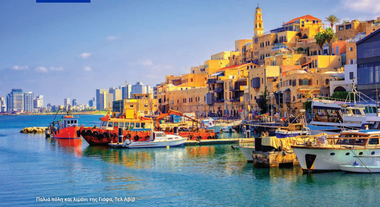
Παλιά πόλη και λιμάνι της Γιάφα, Τελ Αβίβ