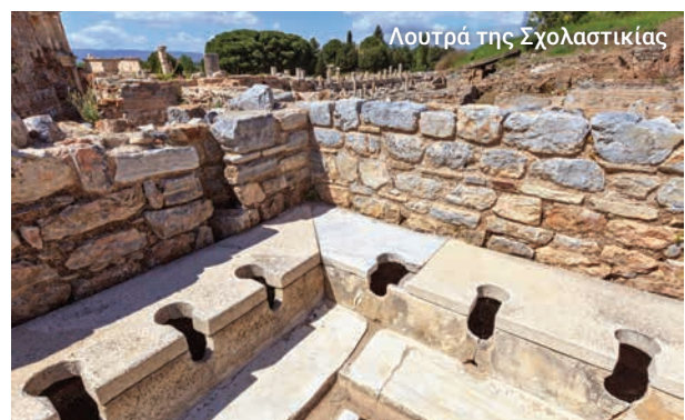
Λουτρά της Σχολαστικής