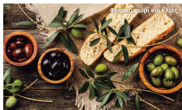
Φρέσκο ψωμί και ελιές

Και μετά, έρχεται η ώρα της επιστροφής με πούλμαν μέσω της Λεμεσού και κατά μήκος της ακτής.