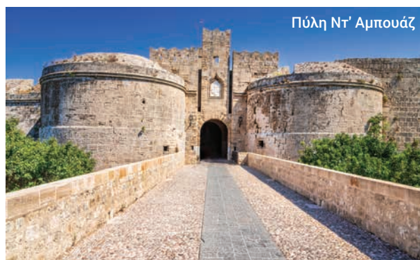
Πύλη Ντ' Αμπούζ

Όπως και να έχει, αυτή η ξενάγηση μας μεταφέρει στην καρδιά της συναρπαστικής ιστορίας της Ρόδου.