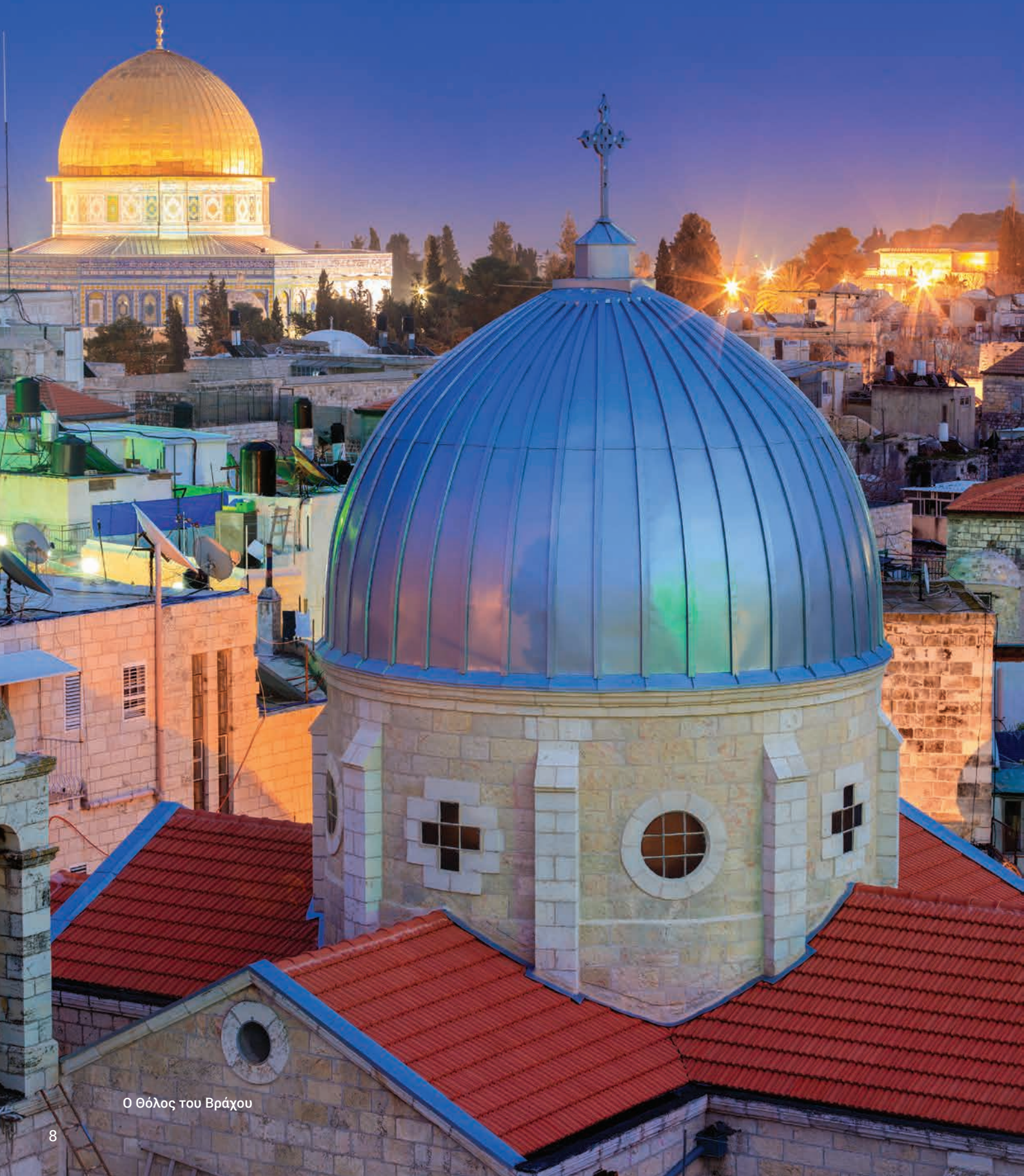
Ο Θόλος του Βράχου