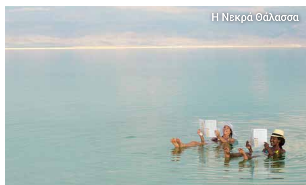
Η Νεκρά Θάλασσα