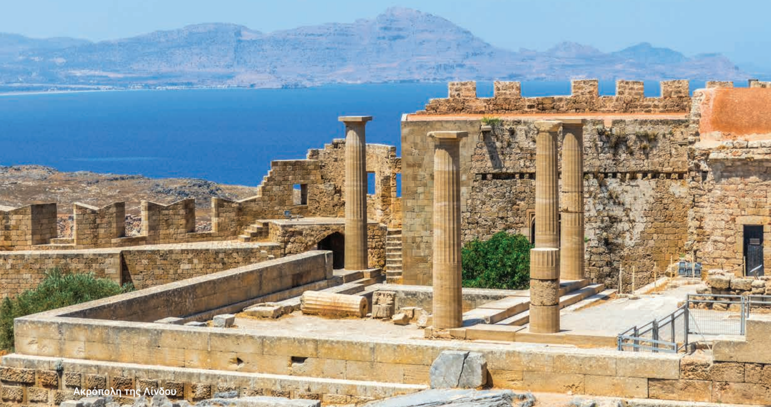
Ακρόπολη της Λίνδου