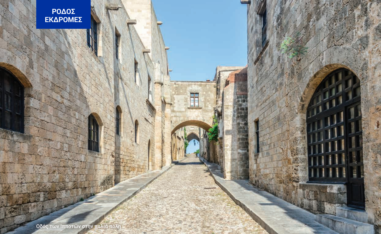
Οδός των Ιπποτών στην παλιά πόλη