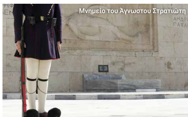
Μνημείο του Άγνωστου Στρατιώτη