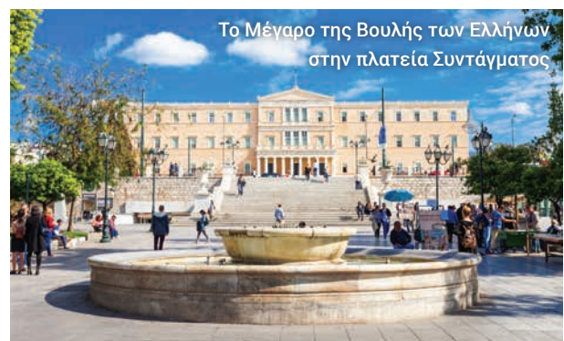
Το Μέγαρο της Βουλής των Ελλήνων στην πλατεία Συντάγματος

Στο τέλος της διαδρομής μας, ελπίζουμε να έχετε γνωρίσει καλά τα μεγαλειώδη μνημεία της κλασικής Αθήνας και να έχετε διαμορφώσει μια καλύτερη ιδέα για μία από τις πιο ιστορικά σημαντικές πρωτεύουσες στον κόσμο.