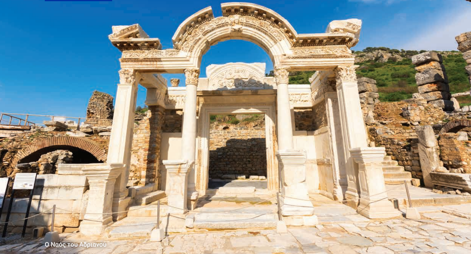
Ο Ναός του Αδριανού