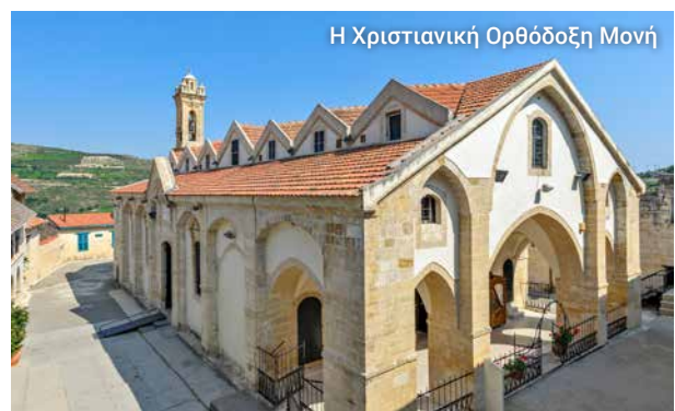
Η Χριστιανική Ορθόδοξη Μονή

Οι λάτρες του κρασιού θα περάσουν λίγες συναρπαστικές και ξεχωριστές ώρες. Για όλους, είναι μια ευκαιρία να γεμίσουν την ψυχή τους με τη γαλήνη του Τρόδους.