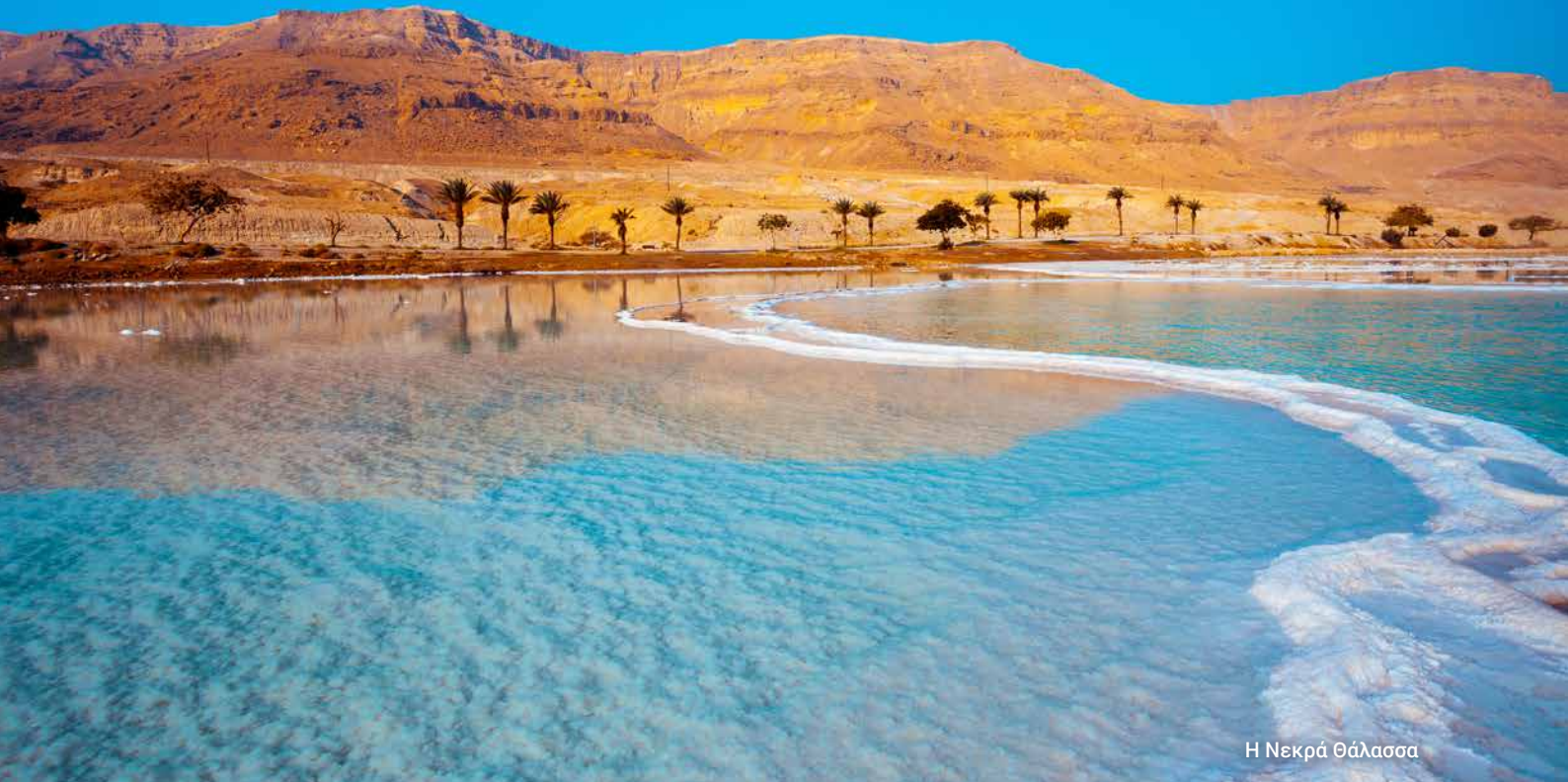
Η Νεκρά Θάλασσα