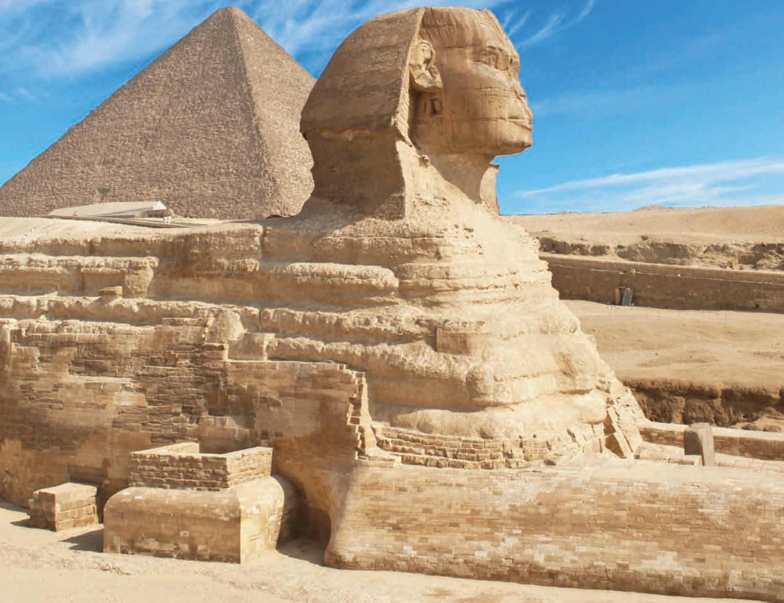
Συγκρότημα της Μεγάλης Πυραμίδας και η Σφίγγα