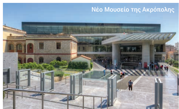
Νέο Μουσείο της Ακρόπολης

Είναι μια μνημειώδης εκδρομή ανακάλυψης, κυριολεκτικά και μεταφορικά.