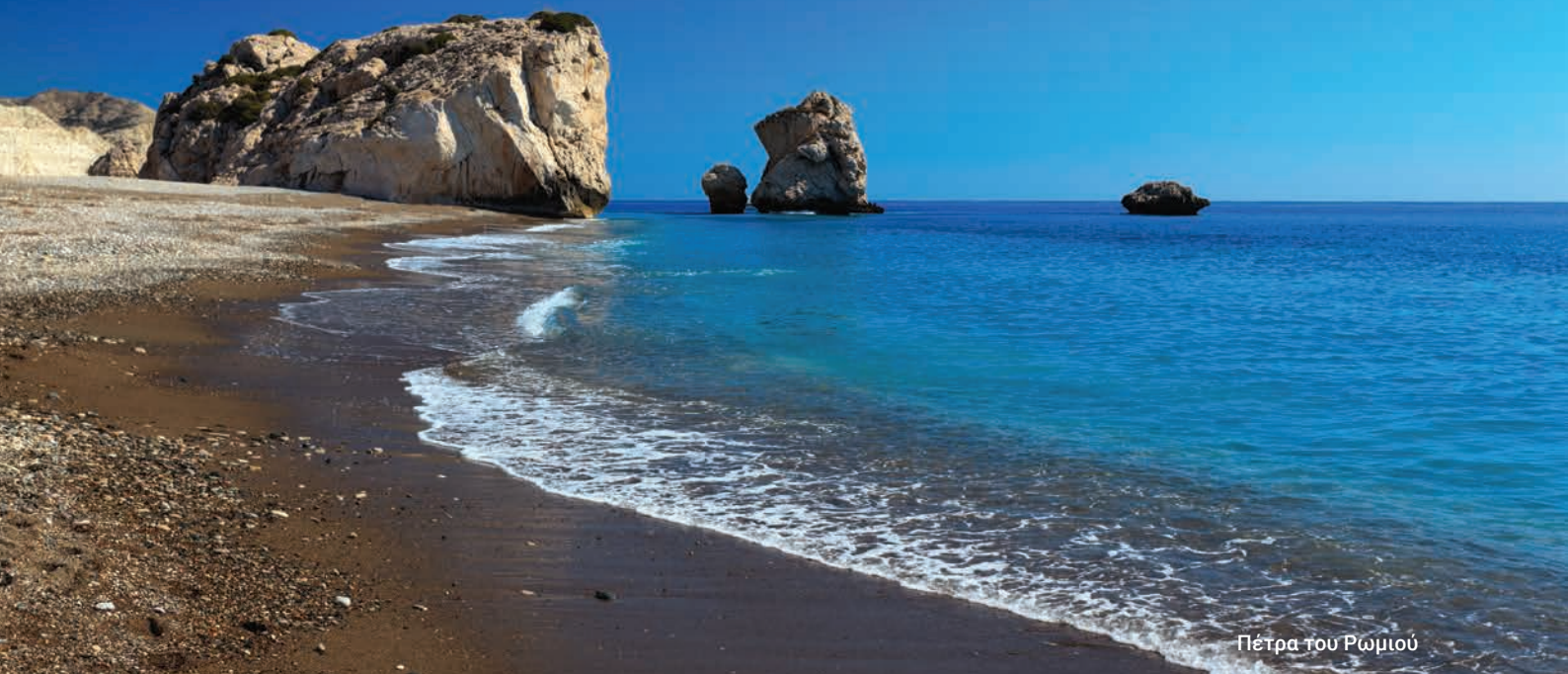
Πέτρα του Ρωμιού