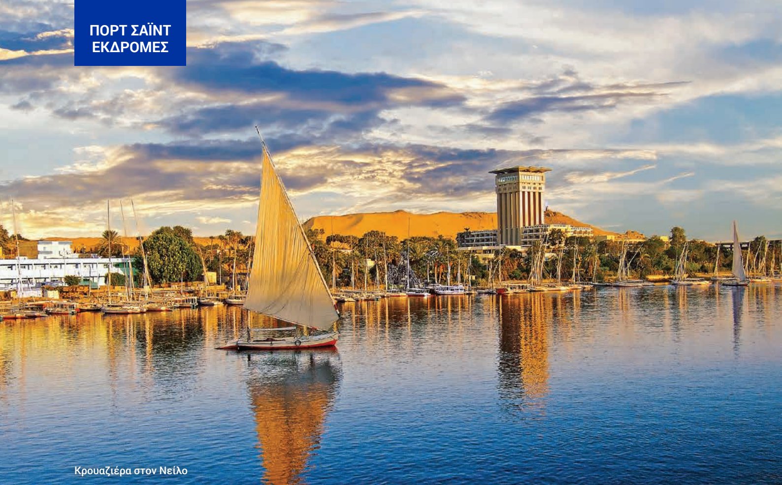
Κρουαζιέρα στον Νείλο