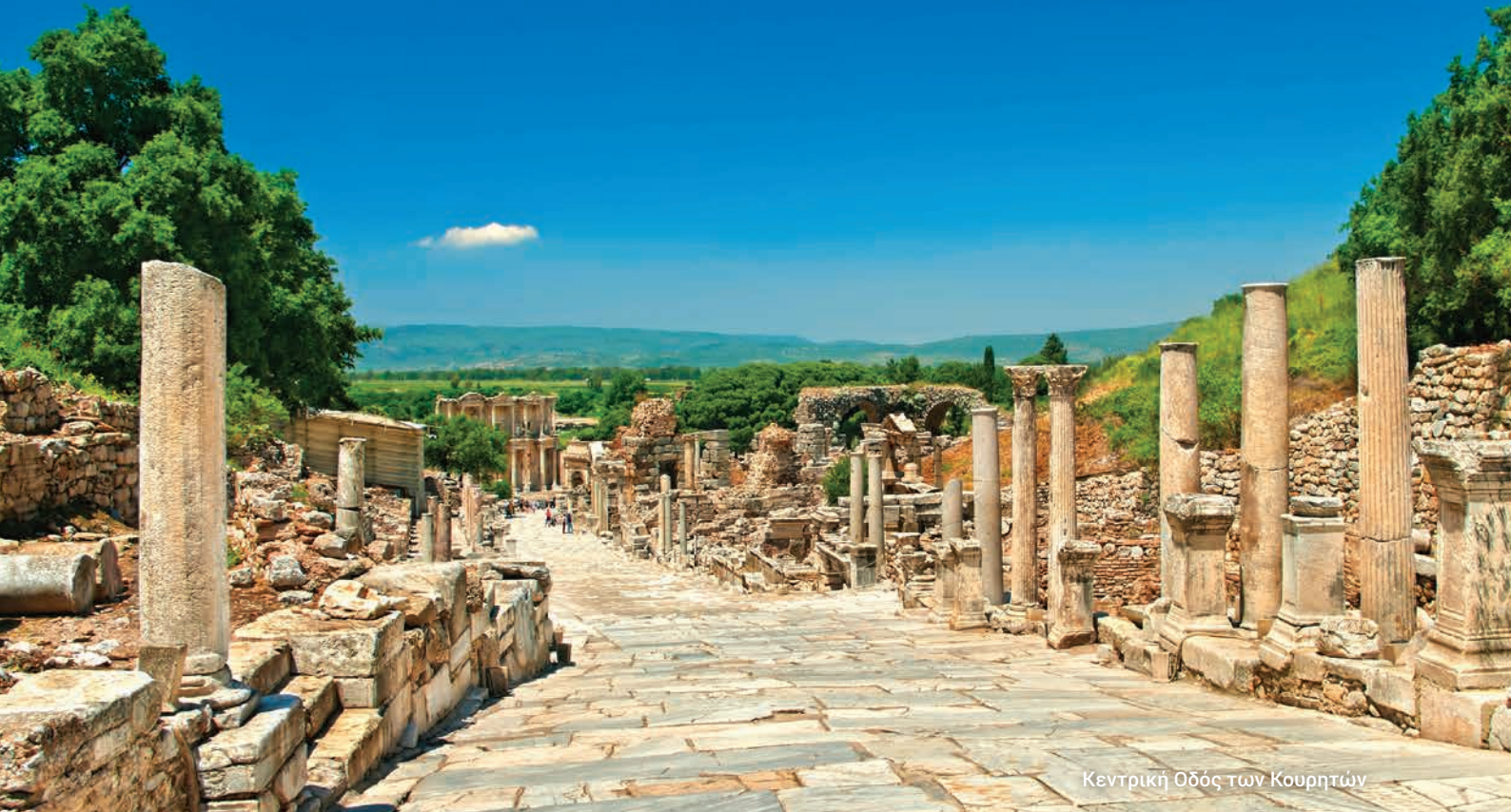
Κεντρική Οδός των Κουρητών