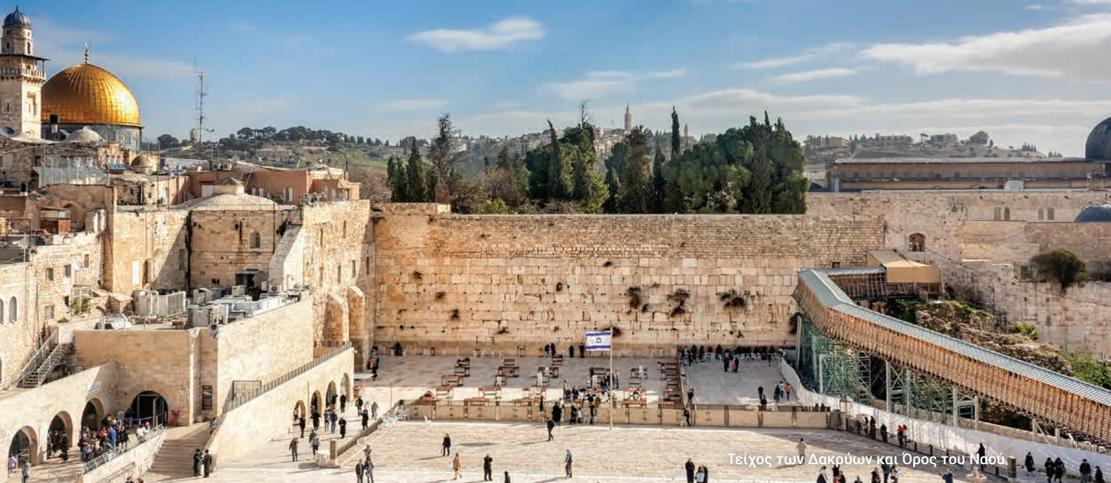
Τείχος των Δακρύων και Όρος του Ναού