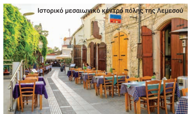
Ιστορικό μεσαιωνικό κέντρο πόλης της Λεμεσού

Το αμφιθέατρο έχει αναστηλωθεί και χρησιμοποιείται πλέον για μουσικές και θεατρικές παραστάσεις, ενώ παράλληλα αποτελεί σημαντικό τουριστικό αξιοθέατο.