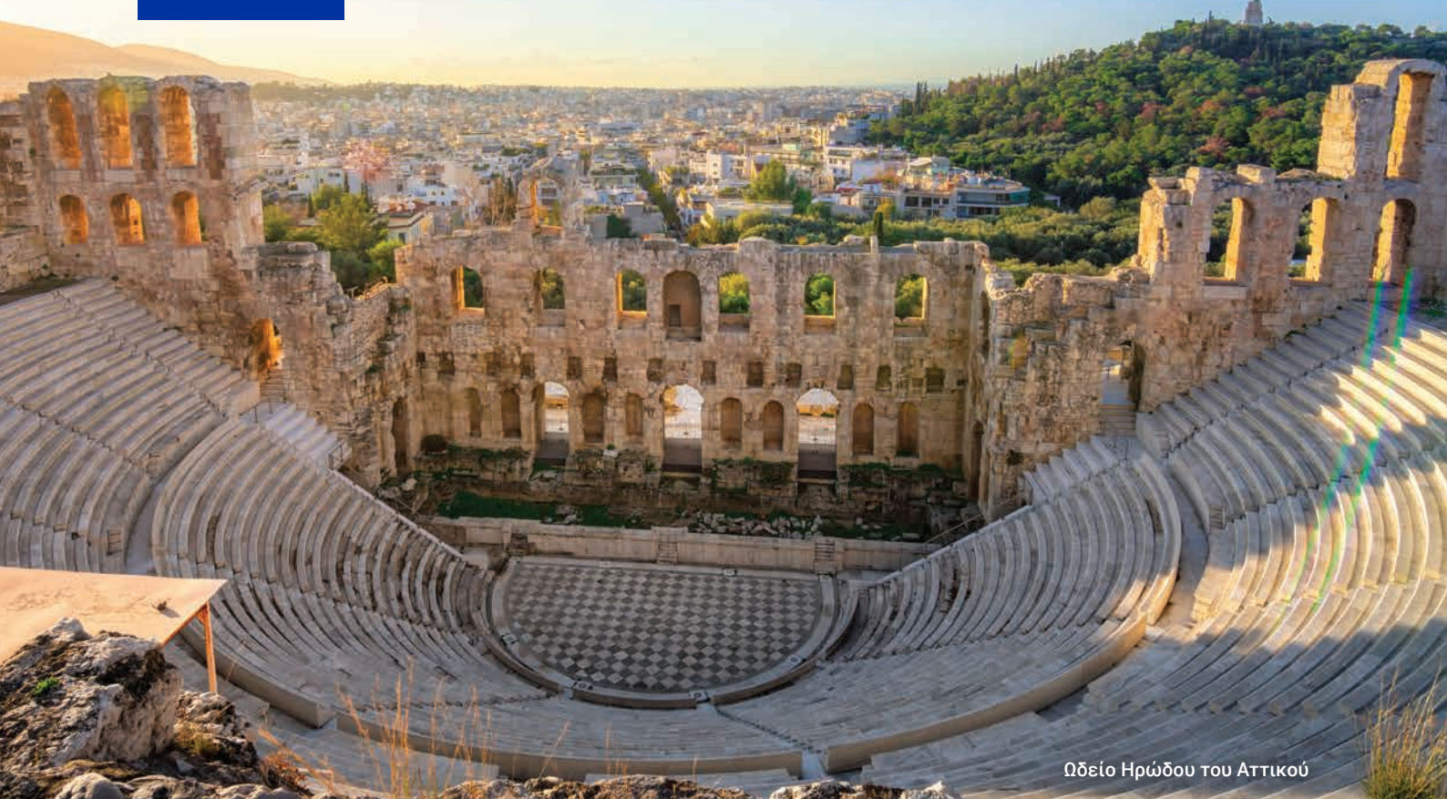
Ωδείο Ηρώδου του Αττικού