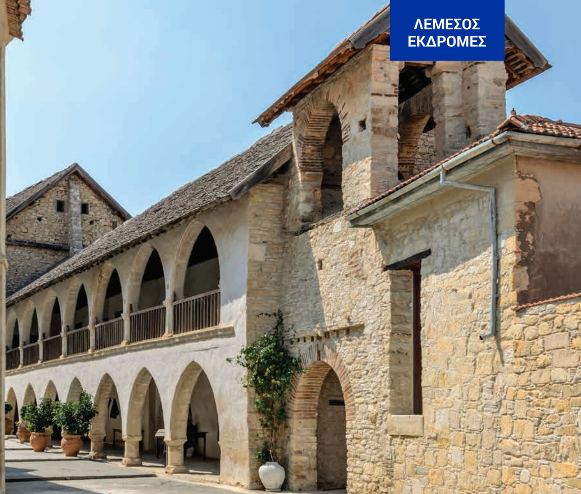
Μονή Τιμίου Σταυρού