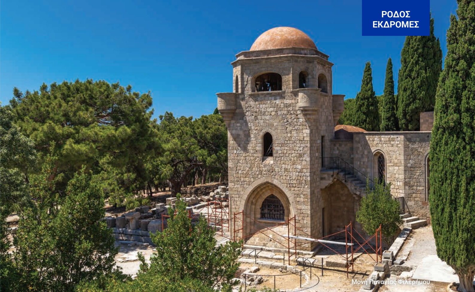
Μονή Παναγίας Φιλερήμου