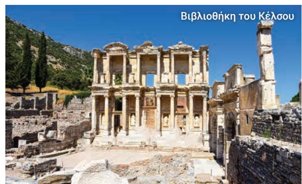
Βιβλιοθήκη του Κέλσου

Στο τέλος της ξενάγησής μας έχουμε χρόνο και για λίγο ...shopping. Επιλέξτε χαλιά, κοσμήματα, δερμάτινα είδη και αναμνηστικά.