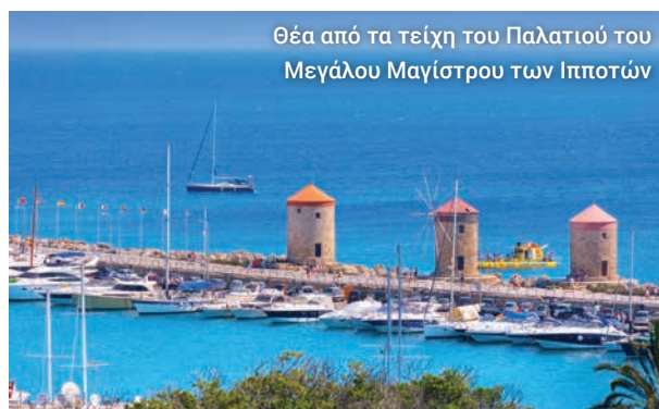
Θέα από τα τείχη του Παλατιού του Μεγάλου Μαγίστρου των Ιπποτών

Η ξενάγησή μας περιλαμβάνει επίσης το Τζαμί του Σουλεϊμάν του Μεγαλοπρεπούς, τα τούρκικα λουτρά, το Νοσοκομείο των Ιπποτών και την Εκκλησία της Παναγίας του Κάστρου, που στέκεται εκεί από τον 11ο αιώνα.