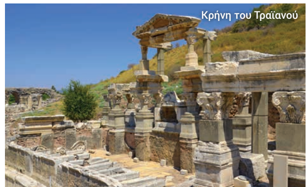
Κρήνη του Τραϊανού

Στο τέλος της ξενάγησής μας έχουμε χρόνο και για λίγο ...shopping. Επιλέξτε χαλιά, κοσμήματα, δερμάτινα είδη και αναμνηστικά.