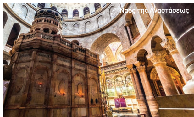
Ναός της Αναστάσεως

Στη συνέχεια ταξιδεύουμε στη Βηθλεέμ, η οποία βρίσκεται στη Δυτική Όχθη, για να επισκεφτούμε τον τόπο της γενέτειρας του Ιησού, τη Βασιλική της Γεννήσεως και την Πλατεία Μαντζέρ. Απολαμβάνουμε το μεσημεριανό μας γεύμα στη Βηθλεέμ και έχουμε χρόνο για την αγορά σουβενίρ προτού επιστρέψουμε και πάλι στο λιμάνι.