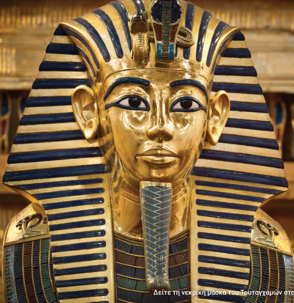
Δείτε τη νεκρική μάσκα του Τουταγχαμών στο Εθνικό Αρχαιολογικό Μουσείο