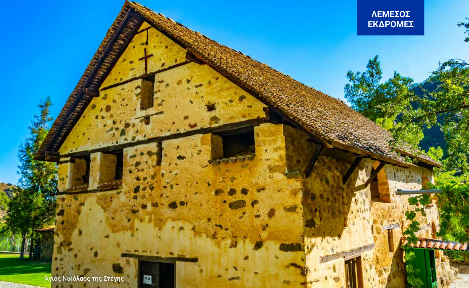
Αγιος Νικόλαος της Στέγης