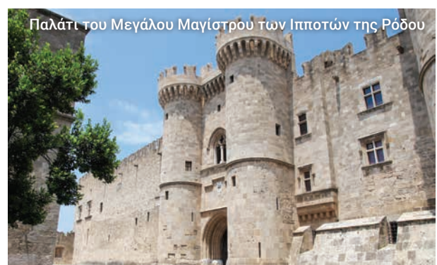
Παλάτι του Μεγάλου Μαγίστρου των Ιπποτών της Ρόδου

Πρόκειται για μία από τις πιο ατμοσφαιρικές και ενδιαφέρουσες περιοχές της Ρόδου, όπου εμβαθύνουμε στην καρδιά και την ψυχή της ιστορίας της.